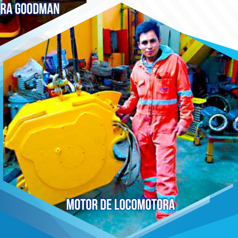
MOTOR DE LOCOMOTORA