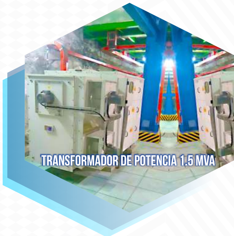
TRANSFORMADOR DE POTENCIA 1.5 MVA

Transformadores de potencia y distribución. Transformadores de control y medida. Tableros de control. Máquinas de soldar. Controles de locomotoras.