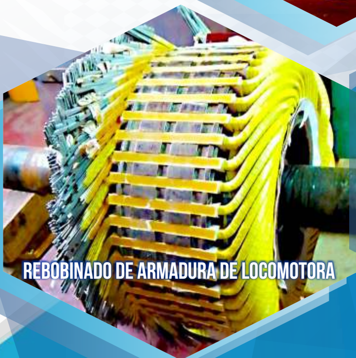
REBOBINADO DE ARMADURA DE LOCOMOTORA