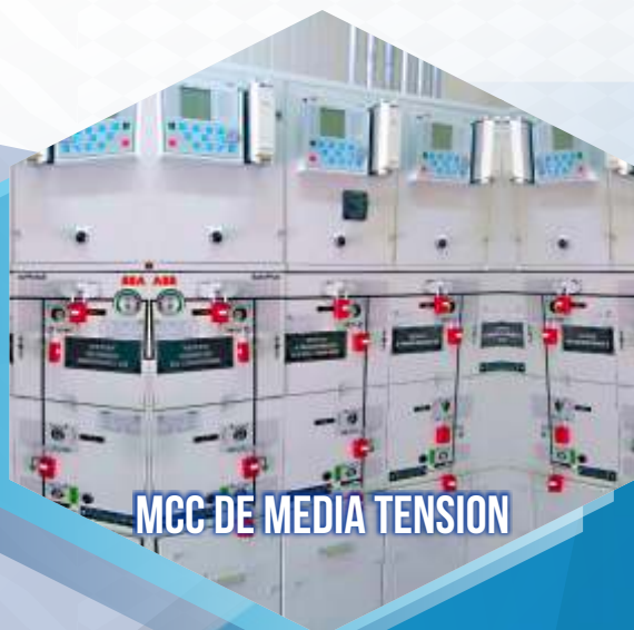
MCC DE MEDIA TENSION

Transformadores de potencia y distribución. Transformadores de control y medida. Tableros de control. Máquinas de soldar. Controles de locomotoras.