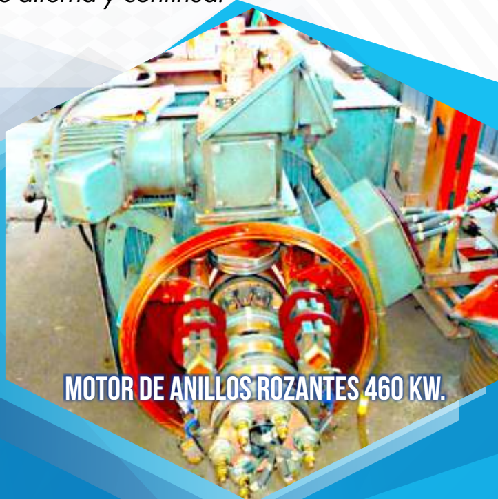
MOTOR DE ANILLOS ROZANTES 460 KW.