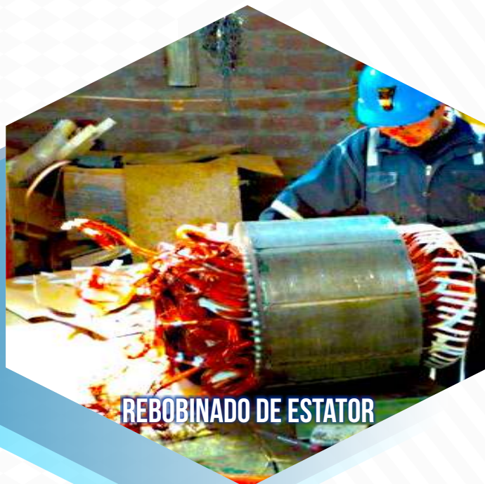
REBOBINADO DE ESTATOR

Motores de corriente alterna Motores de inducción de 0.5 KW, a mayor potencia Motores de corriente continua Motores de tracción de locomotoras. Generadores de corriente alterna y continúa.