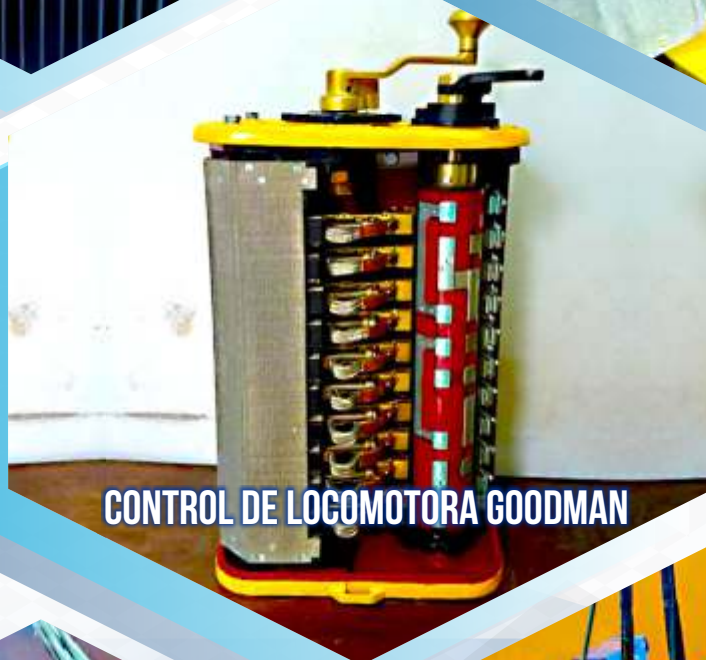
CONTROL DE LOCOMOTORA GOODMAN