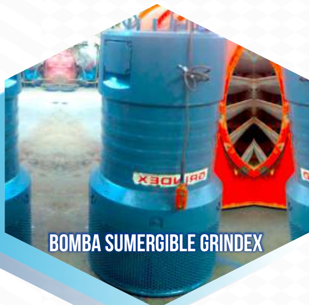
BOMBA SUMERGIBLE GRINDEX