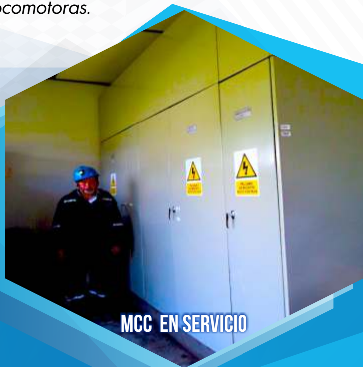
MCC EN SERVICIO