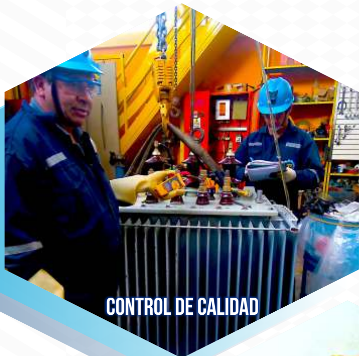
CONTROL DE CALIDAD