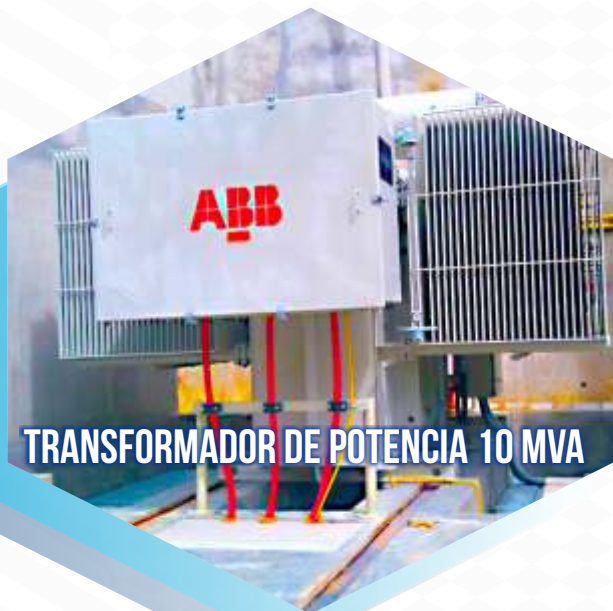
TRANSFORMADOR DE POTENCIA 10 MVA